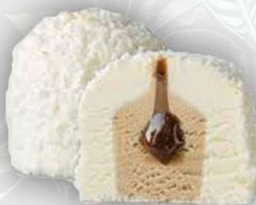
TARTUFO BIANCO *