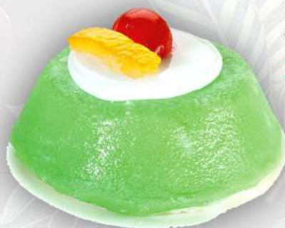
CASSATA SICILIANA *