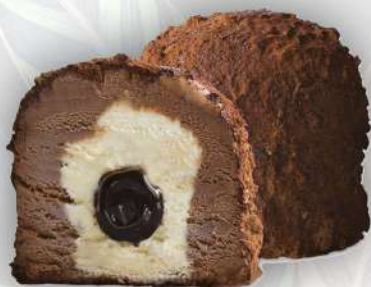
TARTUFO NERO *