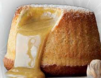
SOUFFLÈ AL PISTACCHIO *