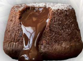
SOUFFLÈ AL CIOCCOLATO *